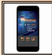
Applikace "Set & Go Pro"

a: čelisti Ø 1" ÷ 5" IPS; 3" ÷ 4" DIPS, tepelně izolační obal do stojanu na topné zrcadlo