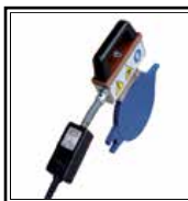
Topné zrcadlo s termostatem Digitální drak