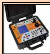
INSPEKTOR záznamové zařízení