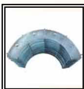
Čelisti Ø 63 ÷ 180 mm