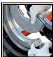
Čelisti Ø 90 ÷ 280 mm master Ø 250 mm