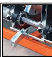
Odtrhovač topného zrcadla