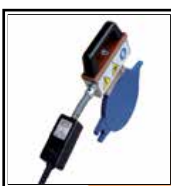
Topné zrcadlo s termostatem Digitální drak