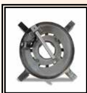
Přípravek na krátké lemové nákrůžky